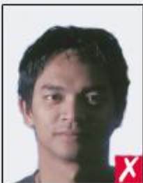
shadows across face