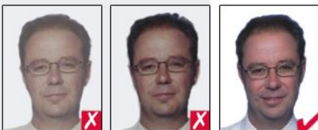
washed out colour