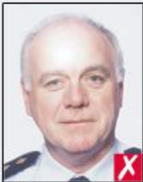
flash reflection on skin