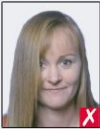
hair across eyes