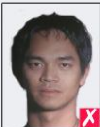
shadows behind head